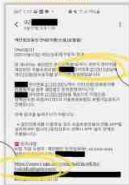
<안내 알림톡 수신 화면>