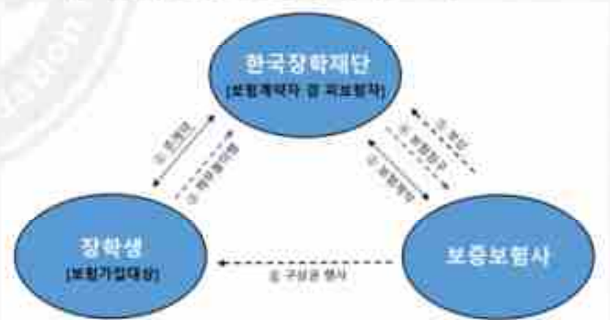
〈중소기업 취업연계 장학사업 이행신용보증보험제도 개관〉