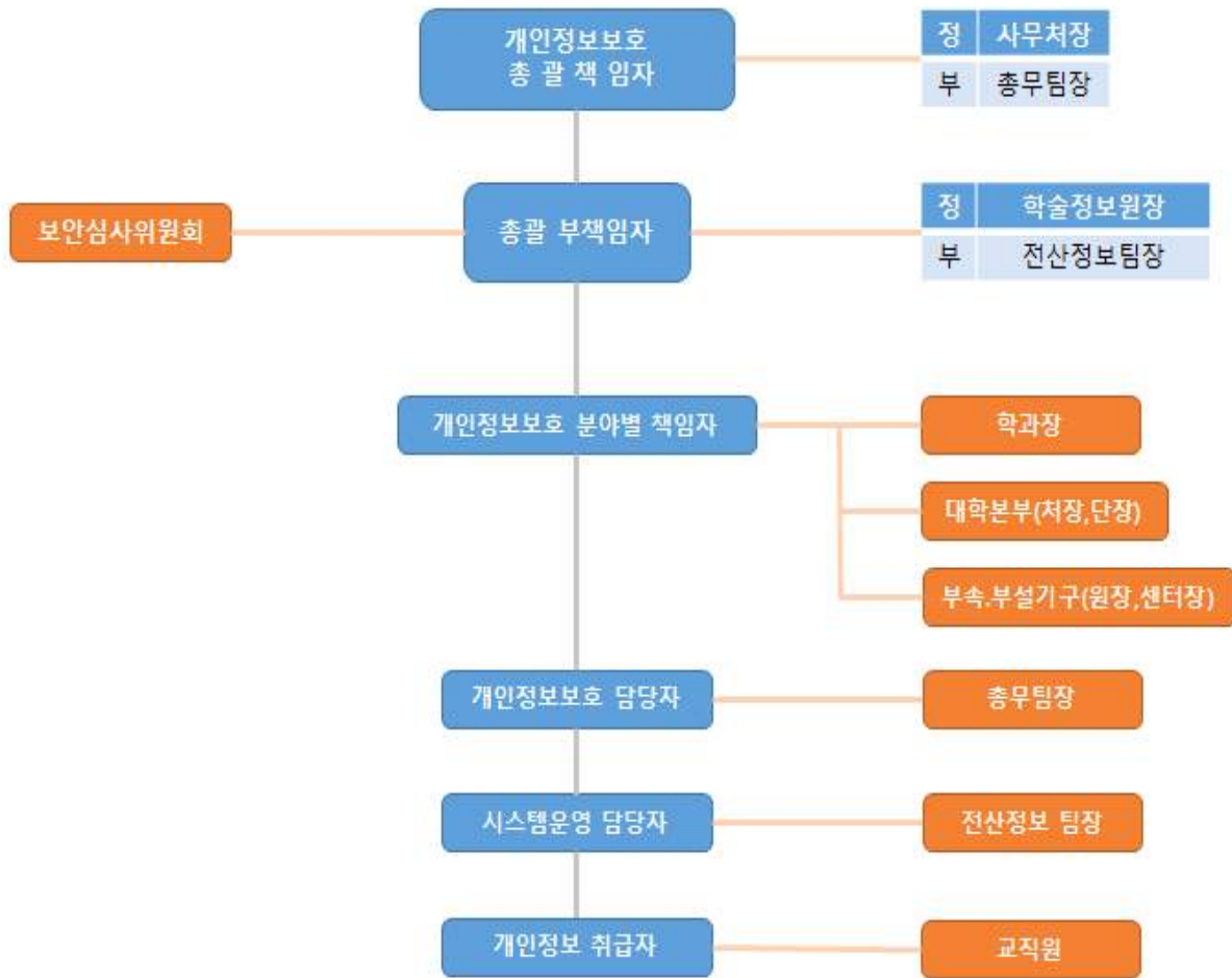
[총괄 책임자 및 분야별 책임자]