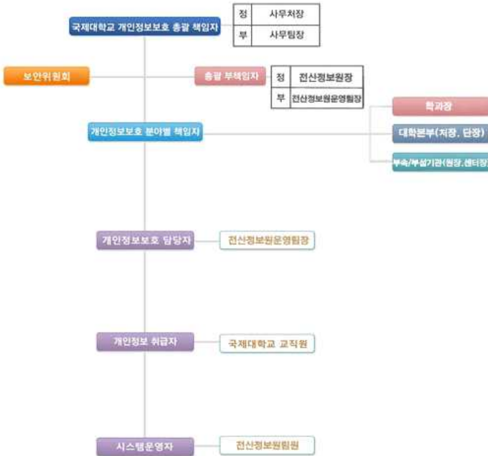
[총괄 책임자 및 분야별 책임자]